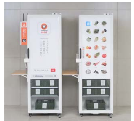
受取用冷蔵庫《マートステーション》

注文した商品は地域に設置された生鮮宅配ボックス「マートステーション」に届けられ、利用者が指定した「マートステーション」から好きな時間にピックアップすることができます。2020年4月より一部地域において自宅への宅配サービス（有料）も開始。ピックアップ・宅配の2つの手段からライフスタイルに合わせたご利用が可能です。マートステーションは東京都23区・神奈川県横浜市・川崎市に約270箇所を設置されています。（10月現在）