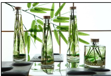
〈竹林のハーバリウム〉