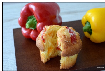
〈新鮮野菜のマフィン〉