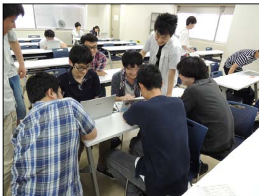
《イベントポータルサイト作成に励む学生たち》