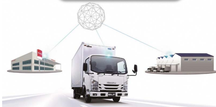
車両の安定稼働を支える 高度純正装備“PREISM”