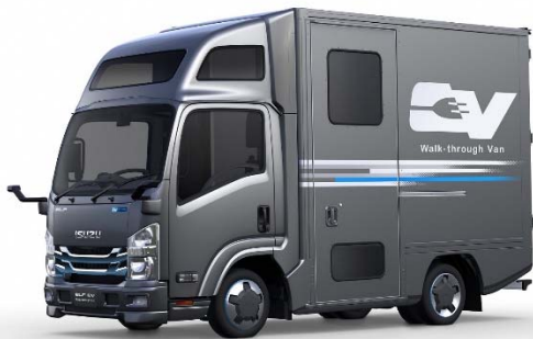
エルフ EV ウォークスルーバン (東京モーターショー2019 出展)