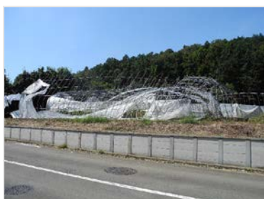
ビニールハウス全壊

ビニールハウスなどの農業用施設や畜舎の損壊などの被害（約1億3,000万円）が発生しました。