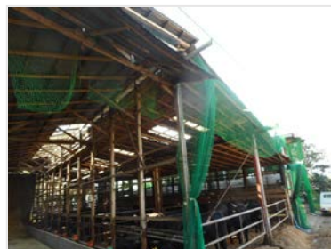
畜舎の屋根の破損