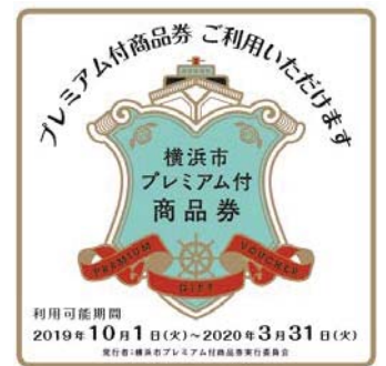
（利用可能店舗ステッカー）

【公式サイトURL】 https://premium-gift.jp/yokohama/use_store