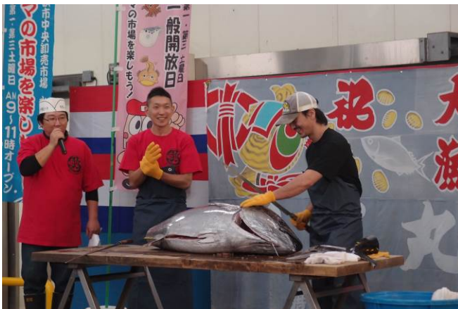
★ マグロの解体ショー