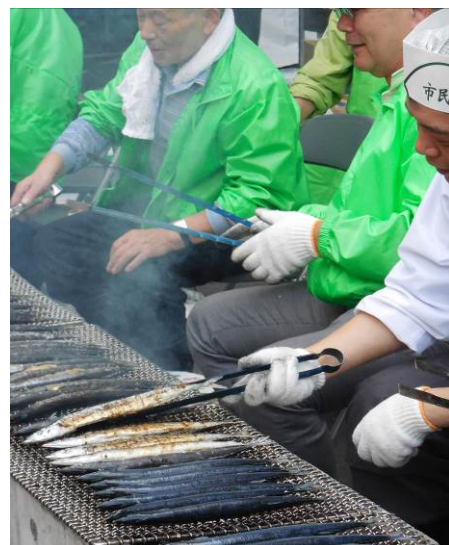
★ 炭火焼きさんまの販売