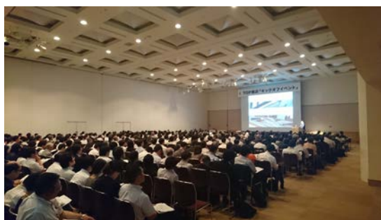
キックオフイベントの様子 (2017.6)