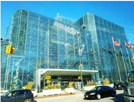
↑ 2019 年 TechDay New York 開催会場