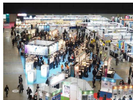
<前回「テクニカルショウヨコハマ 2017」の様子>