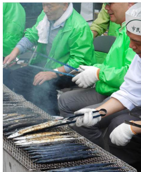
★ 炭火焼きさんまの販売