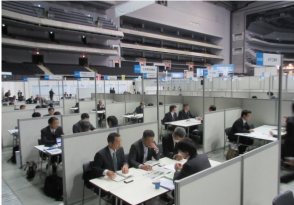
イメージ（昨年度の商談風景）

首都圏産業の国際競争力の強化を図るため、平成20年度から九都県市（埼玉県、千葉県、東京都、神奈川県、横浜市、川崎市、千葉市、さいたま市、相模原市）が連携して合同商談会を開催しています。