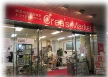
クレアズマーケット 【Crea's Marketの外観】