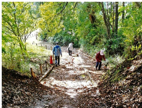
清掃活動を行っている様子

後継者不足により存続が困難となる愛護会が少ない中、当会はとても幅広い年代が参加しており、楽しみながら気持ちよく活動を行い3世代にわたり活動を継承しています。自然豊かな舞岡ふるさとの森を地域にとって愛着のある空間として守る活動を続けています。