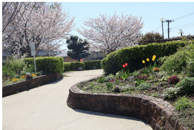
活動場所の磯子峯第二公園

さらに、高校生ボランティアの受け入れなど、無理なく楽しく参加できる取り組みを大切にしながら、公園を中心とした地域交流や次世代育成にも積極的に取り組みます。