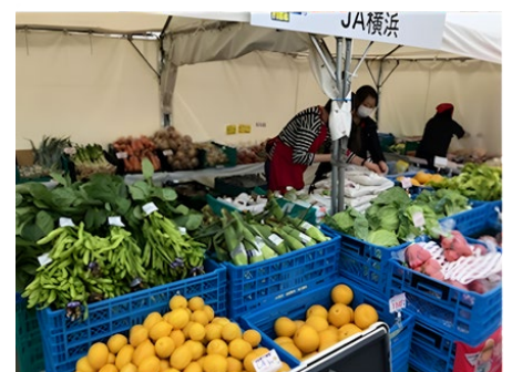
ミニマルシェ イメージ