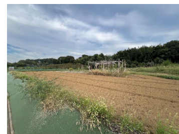
体験会場イメージ