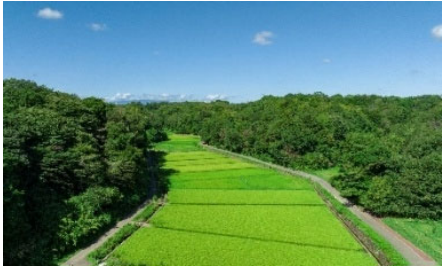
寺家ふるさと村の景観

横浜市では、良好な田園景観を有する地域を「横浜ふるさと村」として指定し、生産基盤整備や研修施設などの設置、樹林の保全・活用など、市民が自然と農業に親しむ場として整備しています。「寺家ふるさと村」は、昭和58年に横浜ふるさと村に指定され、これまで各種体験・交流事業等が実施されてきました。