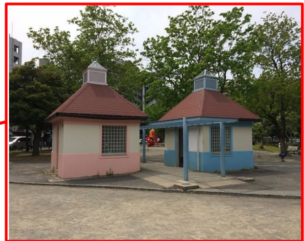
青木小学校の児童が塗装を体験するトイレ