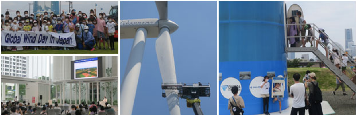
（写真）横浜市風力発電所（ハマウィング）普及啓発、維持管理等の様子

横浜市風力発電所（ハマウィング）は、令和4年4月から12月までの9か月間で、韓国やタイなど海外からの見学者・視察者も含め、1,100名以上の方にお越しいただいています。