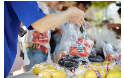
みなとみらい農家朝市の開催の様子