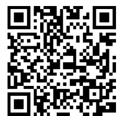
横浜農場公式 Instagram @yokohama_farm_official