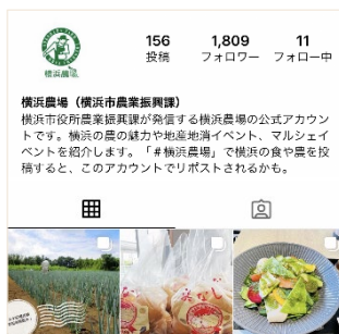
アカウントトップ