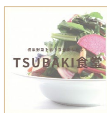
投稿画像イメージ