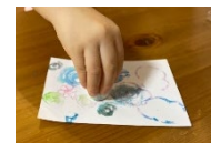
ポストカードづくり