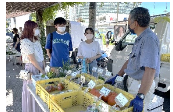
農家への説明の様子