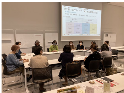
【連続セミナー・交流会の様子】