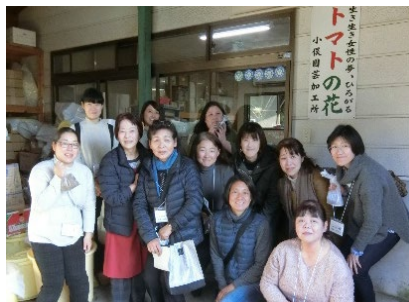
【他都市の加工所の視察研修会】