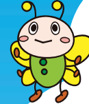
よこはまかんきょうこうどう 横浜市環境行動 キャラクター「エコポン」