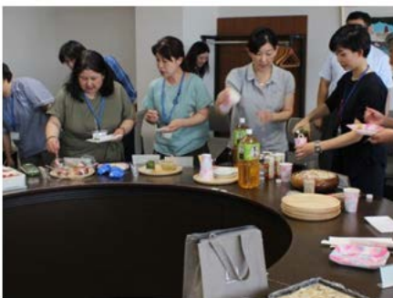
【よこはまゆめ交流会】

交流会では、各自がおすすめの一品を持ち寄り、よこはま・ゆめ・ファーマー同士の交流を深めることができました。