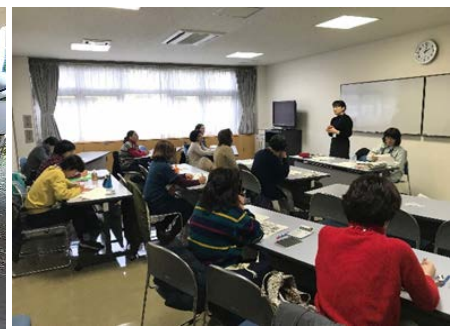
【加工品の座学研修会】