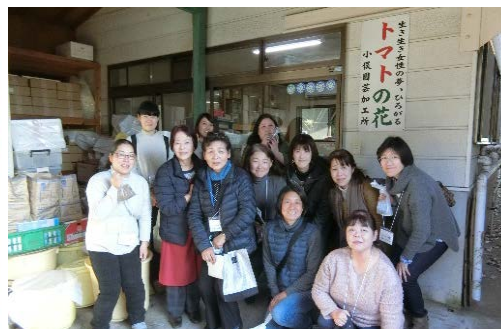
【他都市の加工所の視察研修会】