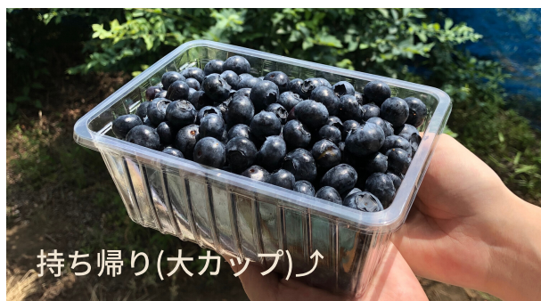
持ち帰り(大カップ)♪