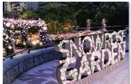
バラとイルミネーションのフォトスポット