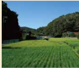
保全された水田(栄区)

水稲作付の10年間継続を条件に土地所有者へ奨励金を交付し、貴重な農景観である水田を 117.5ha 保全しました。