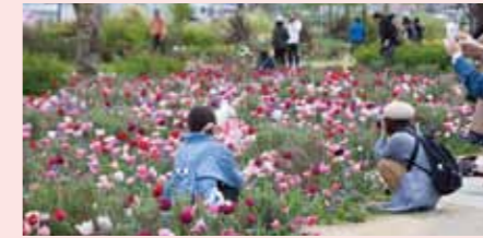
新港中央広場(中区)

都心臨海部において、花や緑による空間演出や質の高い維持管理を集中的に展開しました。全国都市緑化よこはまフェアや、「ガーデンネックレス横浜2018」の会場としても活用し、多くの方にお楽しみいただきました。