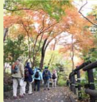
みどりアップ健康ウォーキング(南区)