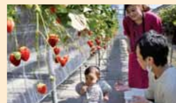
収穫体験農園(旭区)