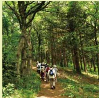
みどりアップ健康ウォーキング(緑区)