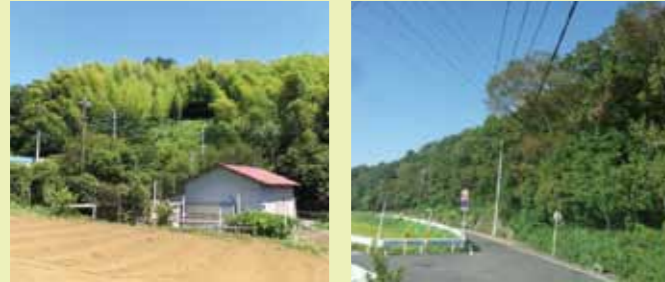
新規指定した源流の森保存地区(青葉区) 土地の買取りをした特別緑地保全地区(泉区)