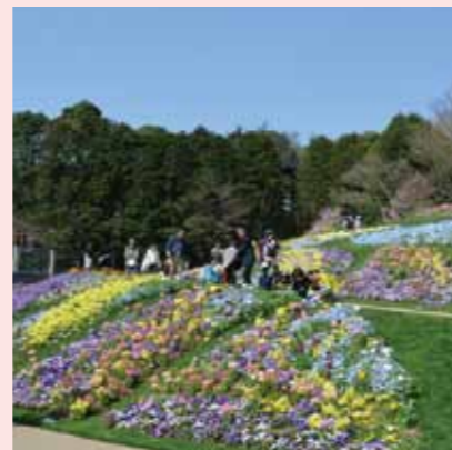
里山ガーデン(旭区)