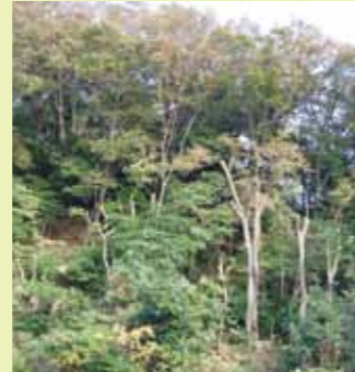
森づくりガイドライン等を活用した森の育成(金沢区)

市民の森や都市公園内の樹林地等で活動する団体の森づくり活動をのべ 179回 支援