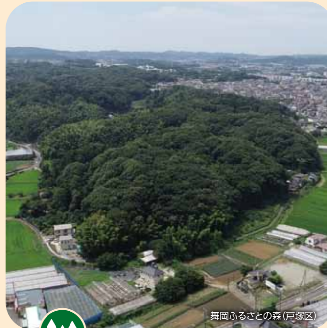
舞岡ふるさとの森(戸塚区)