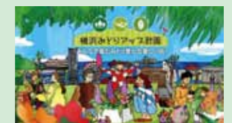
PRアニメーションの映画館等での上映