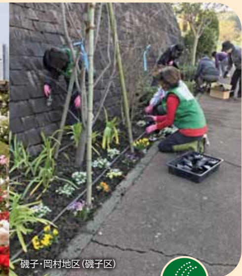
磯子・岡村地区(磯子区)