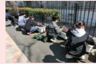
中之丸地区(港南区)

地域が主体となり、地域にふさわしい緑を創出する計画をつくり、計画を実現していくための取組を、 47地区 の市民と協働して進めました。