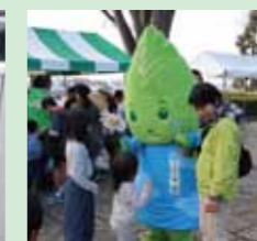
イベントでのPR(保土ケ谷区)