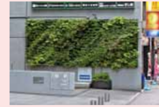
新横浜二丁目地区(港北区)

北寺尾地区の『鶴見「みどりのルート1」をつくる会』が、第38回「緑の都市賞」内閣総理大臣賞を受賞しました。