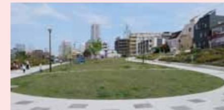
伊勢町もくせい公園(西区)

公有地化によるシンボリックな緑の創出 緑の少ない区(鶴見、神奈川、西、中、南など)において緑豊かな公園の整備により街の魅力や賑わいづくりにつなげました。