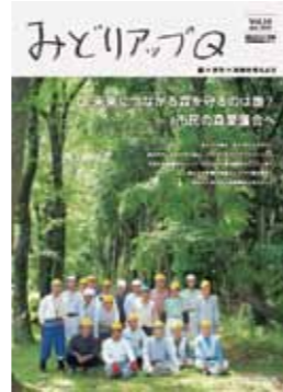
広報誌「みどりアップQ」