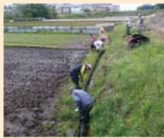
地域団体による水路清掃(瀬谷区)

農業者団体が実施する農地周辺の維持管理の取組を支援したほか、意欲ある担い手に 130.3ha の農地を長期に貸し付け耕作されたことで、良好な農景観が保全されました。