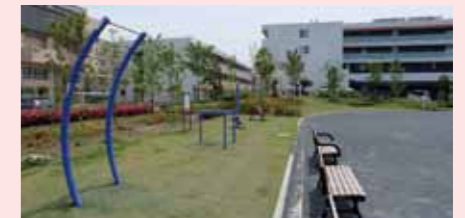
下野谷町三丁目公園(鶴見区)