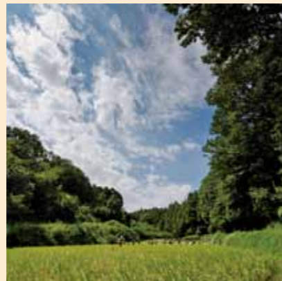
保全された水田(緑区)