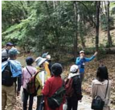
現地調査(調査部会)「みどりアップを見に行こうツアー」(左:都筑区、右:青葉区)