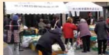
直売所等の支援(緑区)