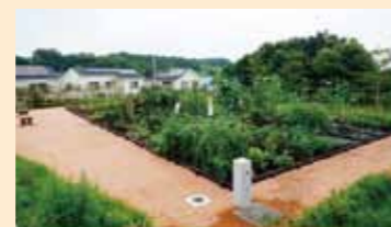
農園付公園(神奈川区)