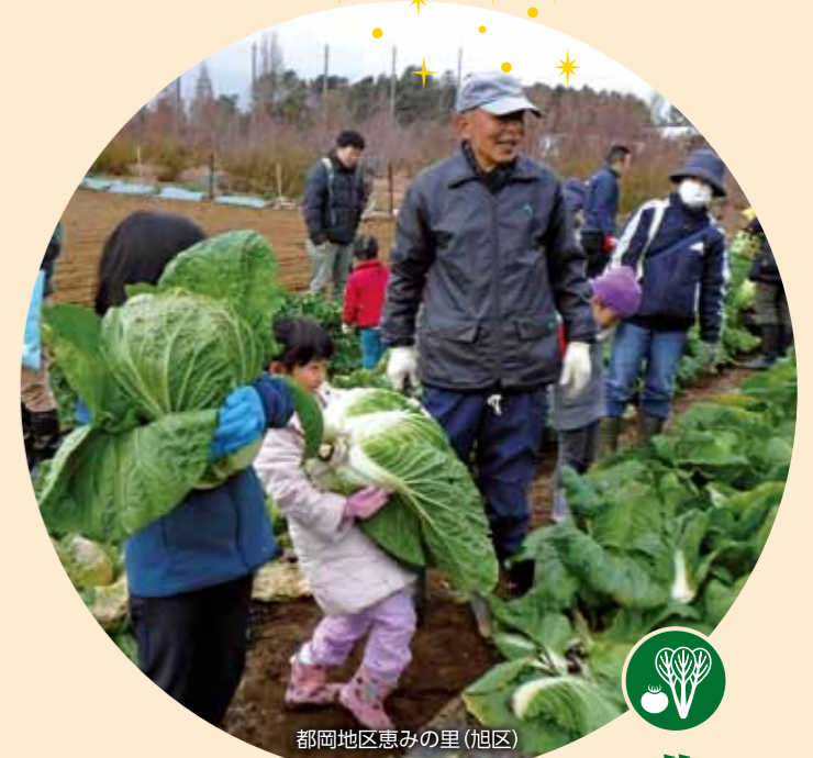
都岡地区恵みの里(旭区)