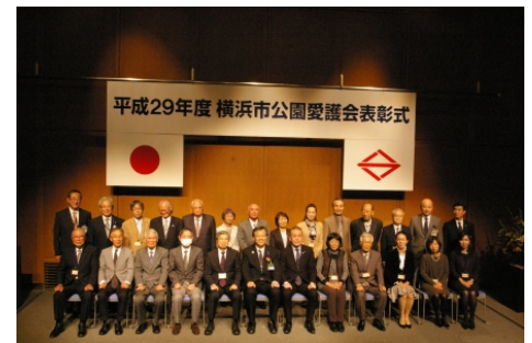
昨年度の表彰式の様子