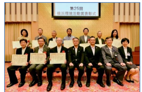
<第25回表彰式の様子>

【生物多様性特別賞】全応募者の中から生物多様性の保全・再生・創造に特に貢献している1者を表彰