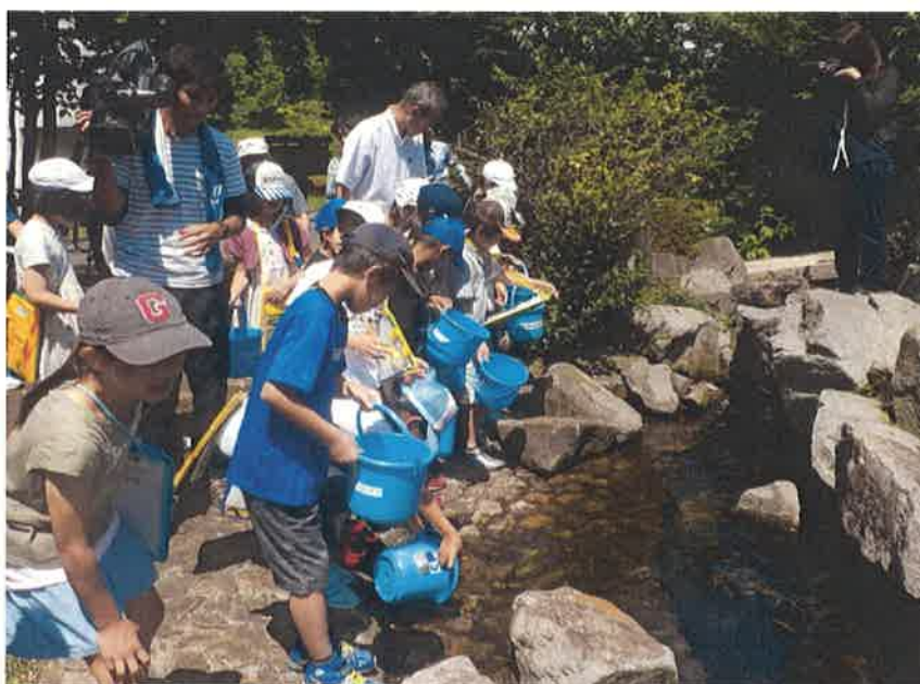
昨年のあゆ放流風景（横浜市立北方小学校の児童の皆さん）

※下水道事業や環境について興味や深い愛着を持ち、横浜市下水道事業のサポーターとして、環境創造局と協働で下水道施設の案内ガイドや環境教育を行っているグループ