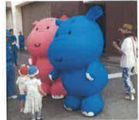
かぼのだいちゃんがお出迎え (水環境事業のキャラクター)