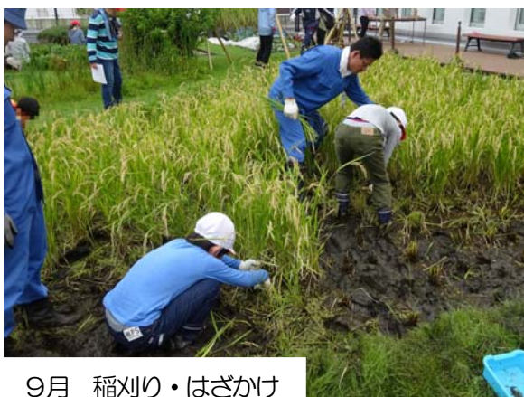
9月 稲刈り・はざかけ