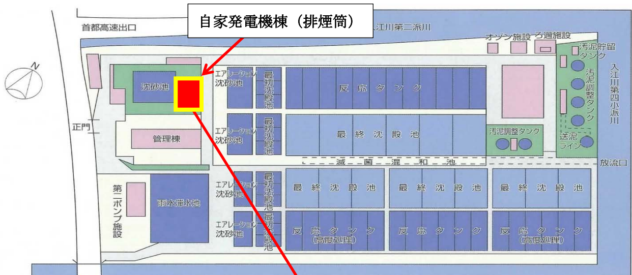
神奈川水再生センター (平面図)