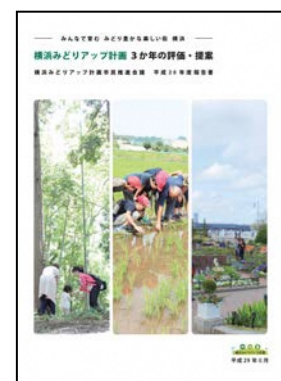
横浜みどりアップ計画 市民推進会議 平成 28 年度報告書

http://www.city.yokohama.lg.jp/kankyo/etc/jyorei/keikaku/midori-up/midori-up-plan/shiminsuishinkaigi/