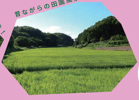
昔ながらの田園風景