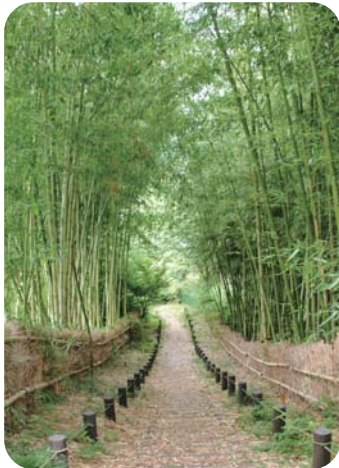
もえぎ野ふれあいの樹林

緑豊かなまち横浜を未来に残すため、市民の皆さんと一緒に緑を守り、つくり、育てていく「横浜みどりアップ計画」。財源の一部に「横浜みどり税」が活用されています。