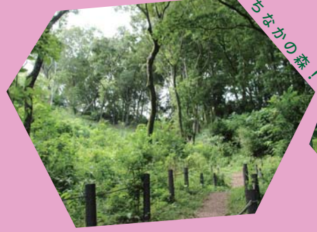
みんなが守る まちなかの森！ もえぎ野ふれあいの樹林