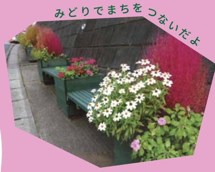
みどりでまちをつないだよ