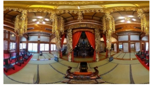
バーチャル体験イメージ（本覺寺の本堂内）

慶運寺、 じんぎようじ 甚行寺、 そうこうじ 宗興寺、 のうまんじ 能満寺、本覺寺（五十音順）