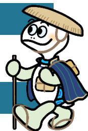
神奈川区 マスコットキャラクター かめ太郎