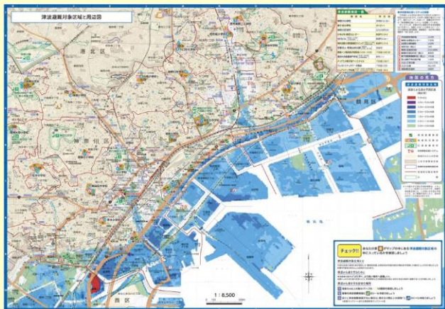
～津波避難対象区域～