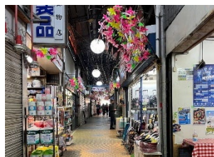
レトロな浜マーケット