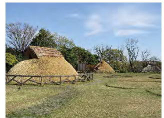
三殿台遺跡(横浜市三殿台考古館)