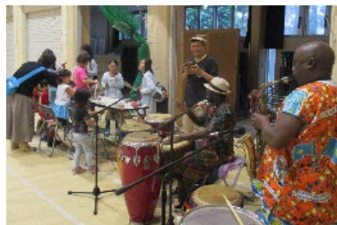
▲展示予定写真の一部