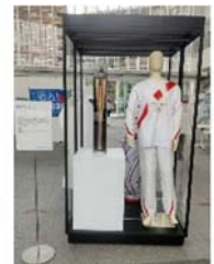
(市庁舎展示時の様子)