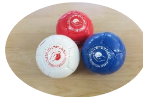
(ボッチャで使用するボール)