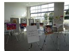
(港南区役所展示時の様子)