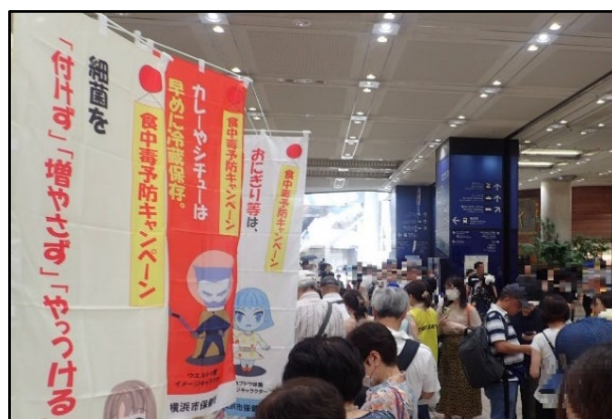
写真：令和6年度西区イベントの様子