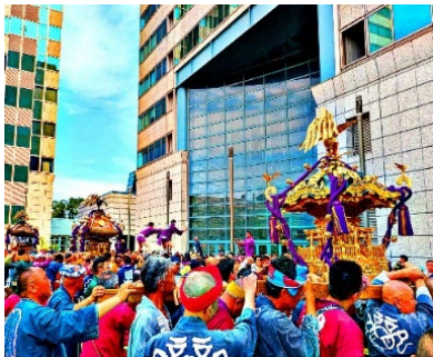
(横浜ビジネスパーク)