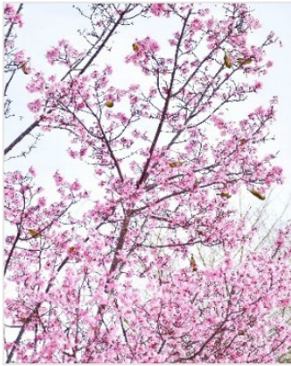
(たちばなの丘公園)