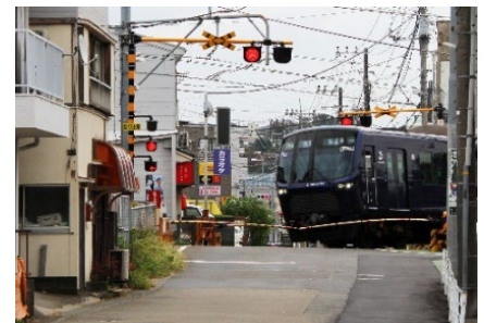
(上星川 6 号踏切道)