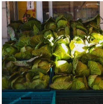
(洪福寺松原商店街)