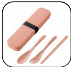
カトラリーセット