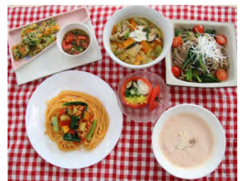
↑ 令和5年度受賞作品