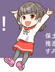
保土ヶ谷区歯科保健 推進キャラクター すみれちゃん