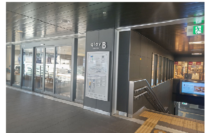
（星天 qlay 外観）