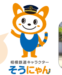
相模鉄道キャラクター そつにゃん