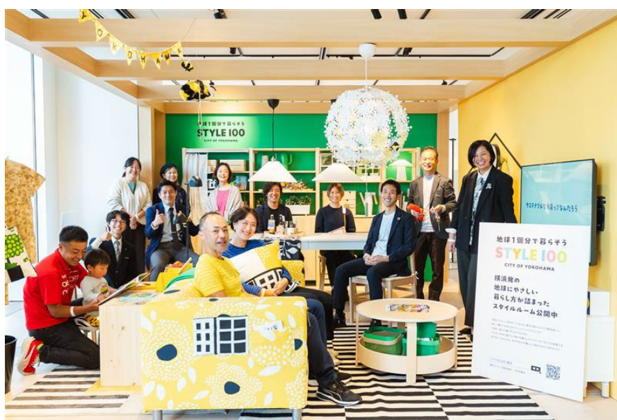
地球1個分の暮らし展 STYLE 実践者の皆様と

今回の企画展では、現在34に達したSTYLEを一堂に紹介。パネル展や、IKEA 横浜の特別協力によるサステナブルなルームセットを通じて、横浜で実践される“地球にやさしい暮らし”を体感できます。ぜひお越しください。