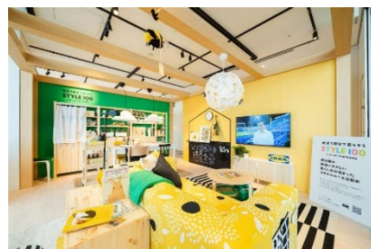
地球1個分の暮らしのお部屋

IKEA 横浜の特別協力で、「地球1個分の暮らし」をテーマにしたルームセット（お部屋！）を展示。IKEA 横浜が本企画のためにコーディネートした空間に、ロスフラワーで染色したTシャツやリサイクルボールなど、15以上のSTYLEにちなんだアイテムを配置。いくつ見つけられるでしょうか？