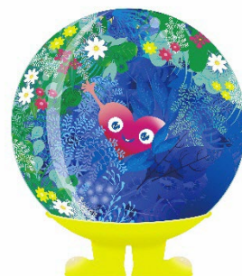
公式マスコットキャラクター「トゥンクトゥンク」

名 称：2027 年国際園芸博覧会 正式略称：GREEN×EXPO 2027（グリーンエクスポニーゼロニーナナ） テ ー マ：幸せを創る明日の風景 開催期間：2027 年 3 月 19 日（金）～9 月 26 日（日） 開催場所：神奈川県横浜市・旧上瀬谷通信施設 博覧会区域：約 100ha（内、会場区域 80ha） クラス：A1（最上位）クラス（AIPH 承認+BIE 認定） 公式サイト： https://expo2027yokohama.or.jp/