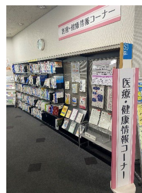
4階 医療・健康情報コーナー

※回答いただいたアンケートの結果は、来年度以降のクールシェアスポット事業に活かしてまいります。