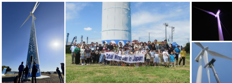
（写真）ハマウィング普及啓発、維持管理等の様子