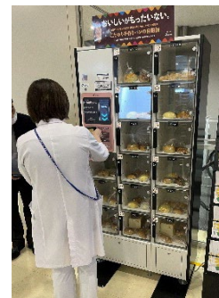
済生会横浜市東部病院