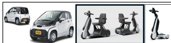
図 出展車両 (左からC+pod、C+walkS、C+walkT)

超小型BEV・C+pod、1人乗り3輪BEV・C+walkの車両展示及び、C+walkの無料試乗会を実施。