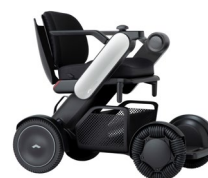
図 出展車両（WHILL model C2）