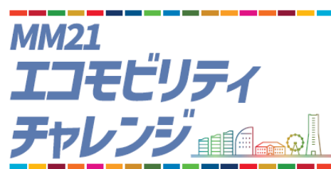
MM21エコモビリティチャレンジロゴ

実施内容：エコモビリティを活用した、交通サービスや技術の展示など。最新の出展情報はホームページをご参照ください。